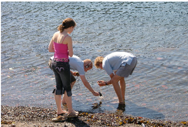
Optak av vannlyder ved Landsteilene,- innholdsproduksjon til lydinstallasjon.

Sommerleiren ble arrangert i samarbeid med Forbundet Unge Forskere (FUF) og Universitetet i Oslo. Dette samarbeidet ble etablert etter et ønske om å eksponere unge mennesker for seriøse, faglige tilbud og å rekruttere disse inn i de institusjonene som samarbeidspartnerne representerer. Emnet for leiren var musikkteknologi, og kunstinstallasjonen ble støttet av Norsk Kulturråd, mens selve leiren ble støttet av Nordisk Kulturråd og NOMUS. I tillegg støtter UiO, ved det humanistiske fakultet, prosjektet med lønn til foredragsholdere.