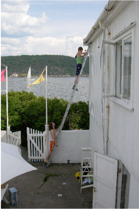
Lydinntallasjonen monteres av deltakerne.